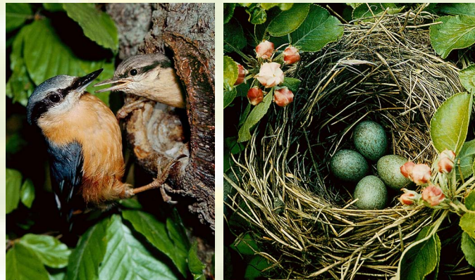
Bilder: Helmut Massny - Blaumeisen, Kleiber, Amselgelege, Gelbspötter