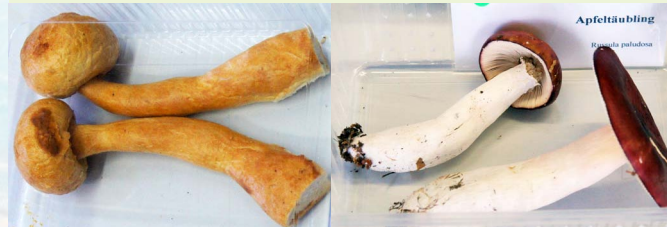
Semmelgelber Bäckerling ( Panopsis farinospora ) Apfeltäubling ( Russola paludosa )

Sonntag, 20.10 - 10:00 bis 16:30 Uhr Alljährliche Frishpilzausstellung mit Diskussions- und Informationsaustausch Veranstalter: Fachgruppe Mykologie